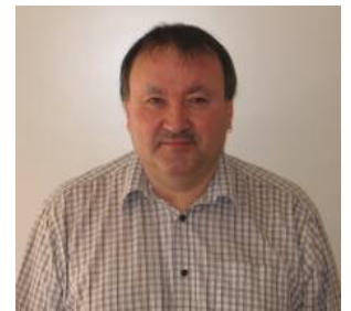
Ikinngutinnersumik inuulluaqqusillunga Med venlig hilsen